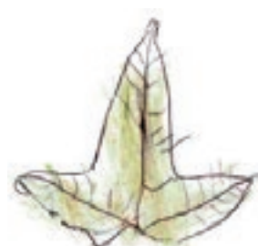
Dessins d'observation d'ombelles et de feuilles d'érable réalisés au parc de la Cavalerie. Les couleurs proviennent de végétaux.