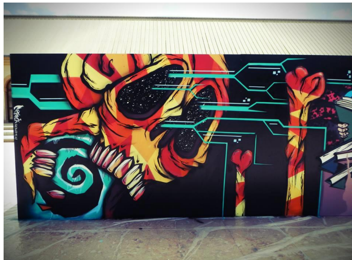
Œuvre de Mr X