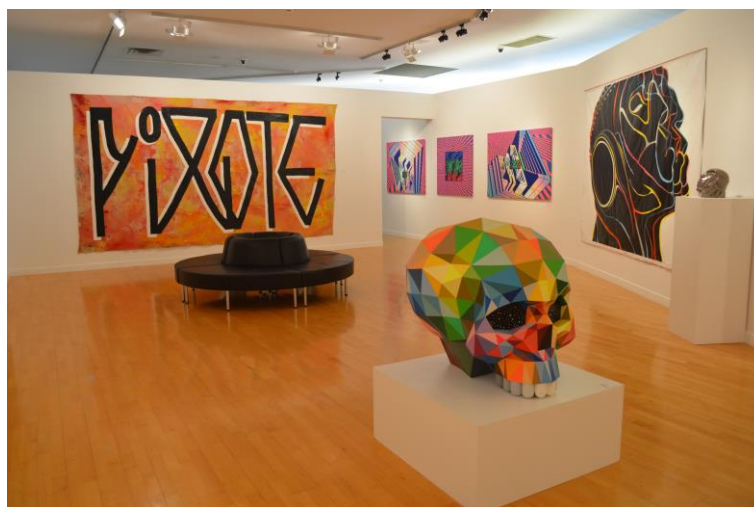
Exposition Z.U.C Cité musicale - Metz