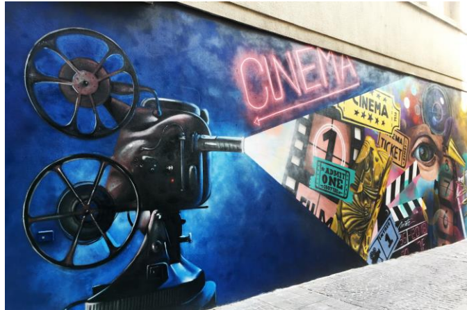
Fresque du Cinéma KLUB de Leskule et Kogaone, collectif Une Phase 2 styles