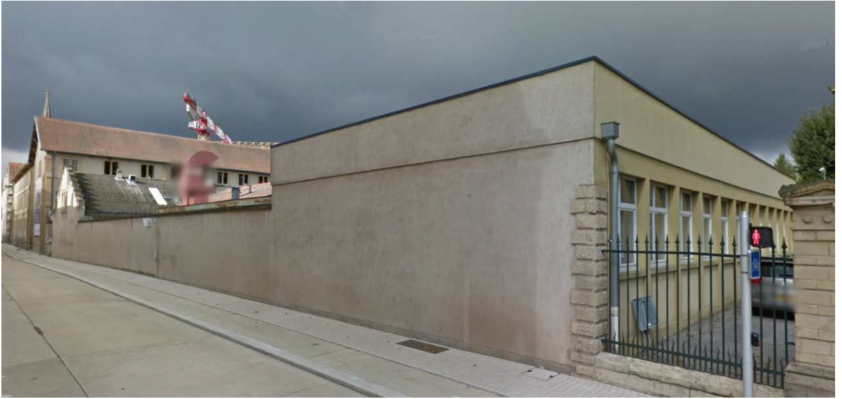
Photographie de la façade