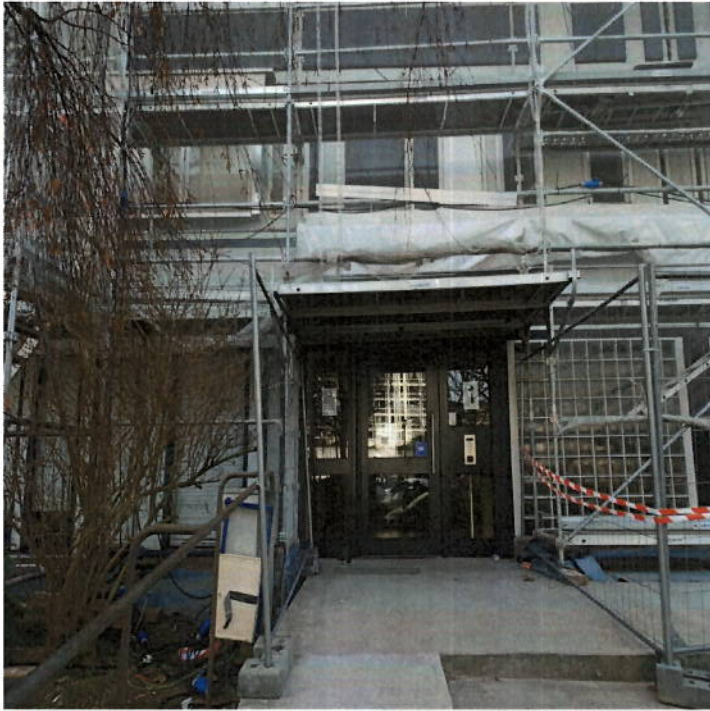
Façade avant protégée dans le cadre du chantier: échafaudage, filet de protection extérieure et tunnel