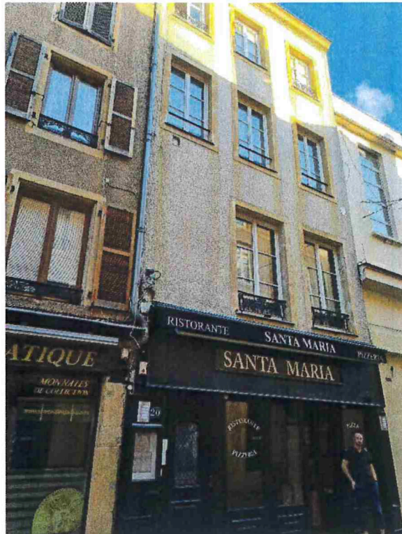
Vue façade sur rue