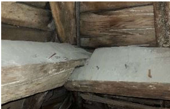
Appuis d'angle normal.