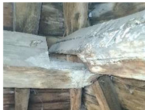
Appuis d'angle anormal.