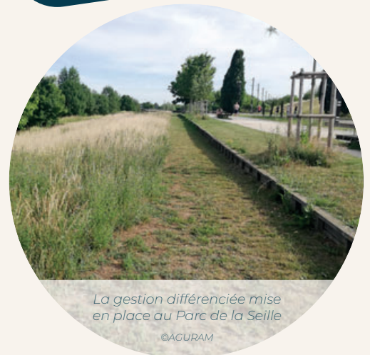
La gestion différenciée mise en place au Parc de la Seille

La gestion différenciée consiste à entretenir un espace vert selon son usage et sa fonction. Certaines zones peuvent être moins tondues que d'autres. La gestion différenciée vise à favoriser la biodiversité, tout en rationalisant les moyens et coûts d'entretien.