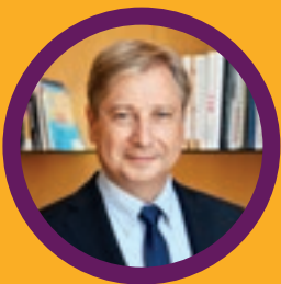
François Grosdidier Maire de Metz Président de l'Eurométropole de Metz Vice-Président de la région Grand Est Membre honoraire du Parlement