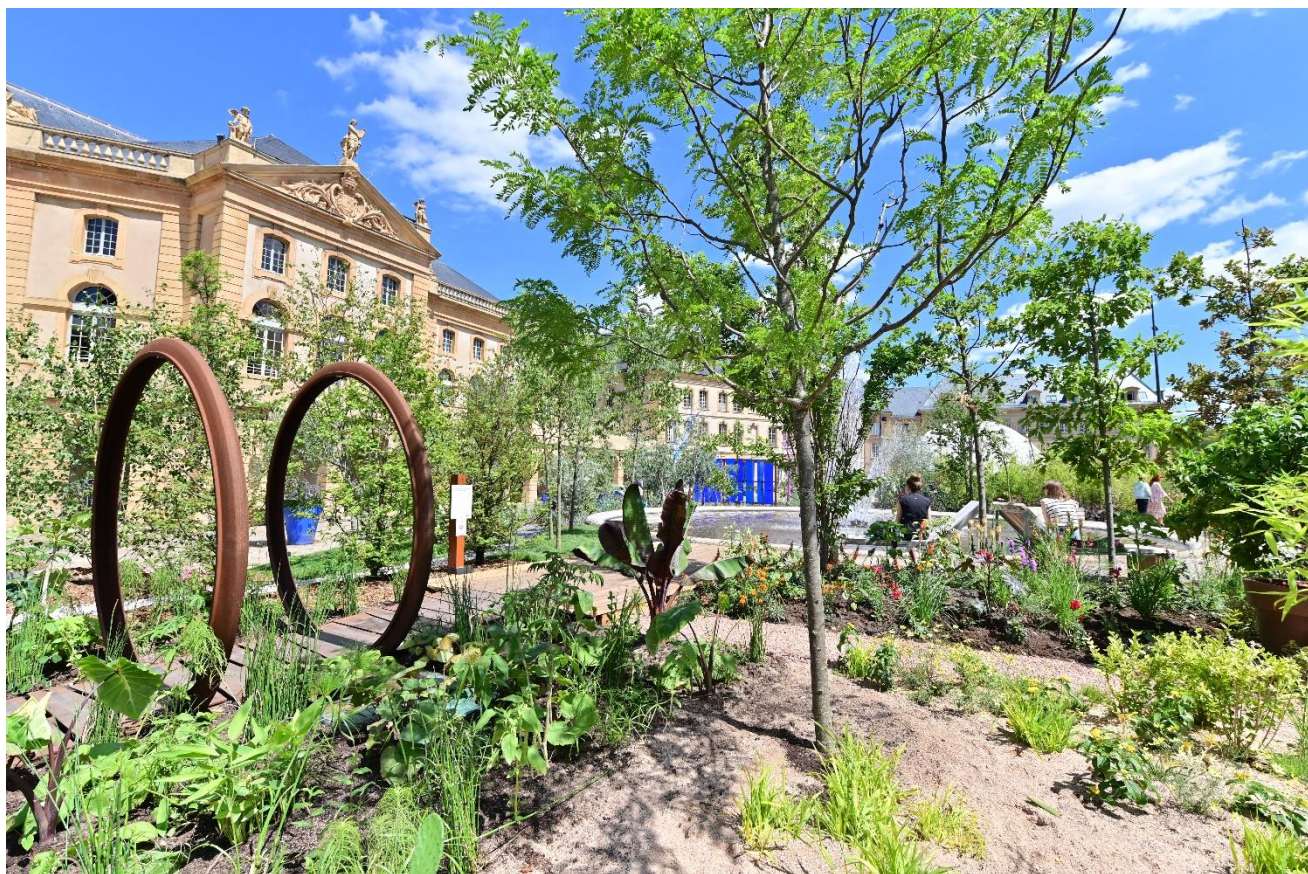
Constellations de Metz 2022, Jardin éphémère « En voir de toutes les couleurs », Place de la Comédie