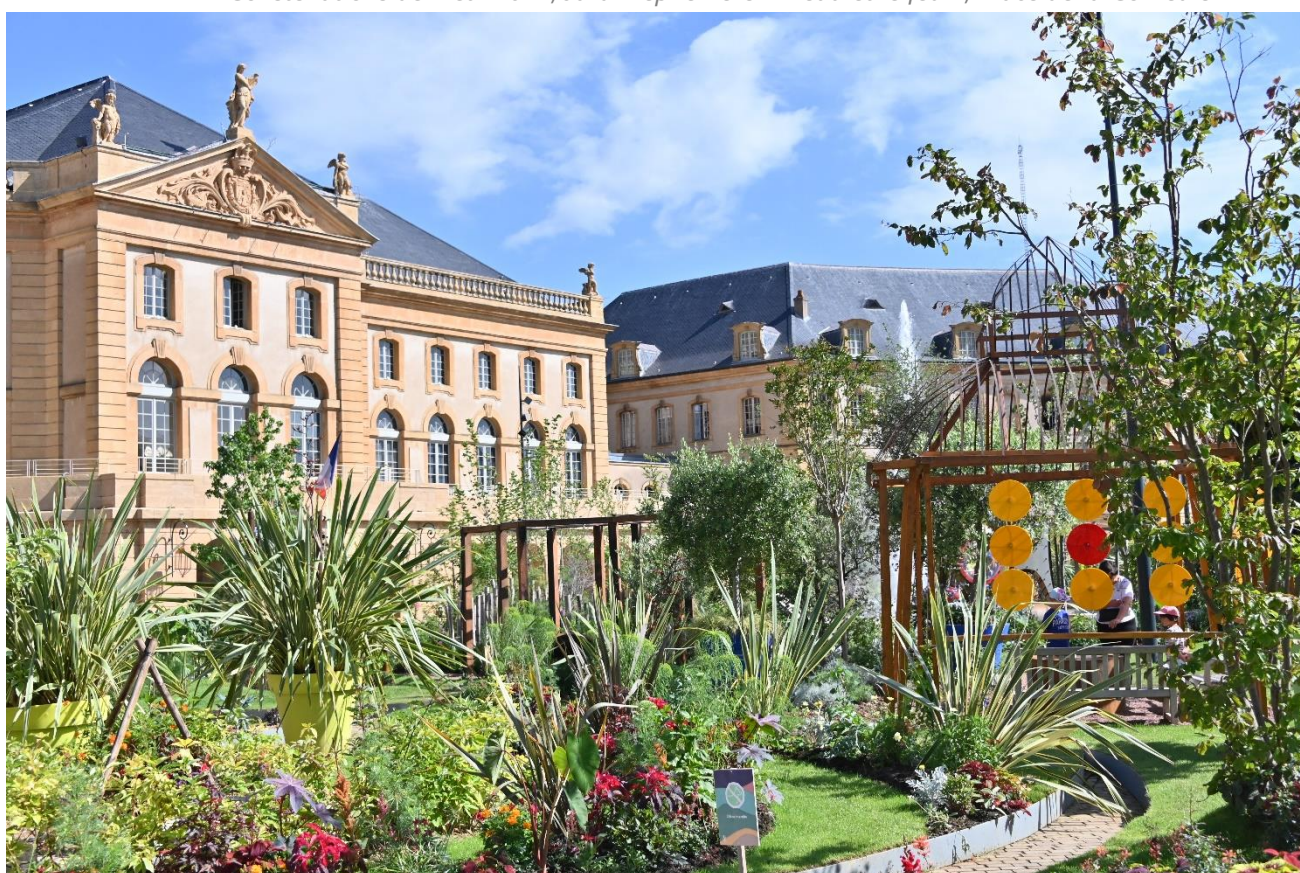
Constellations de Metz 2021, Jardin éphémère « L'eau et le feu », Place de la Comédie