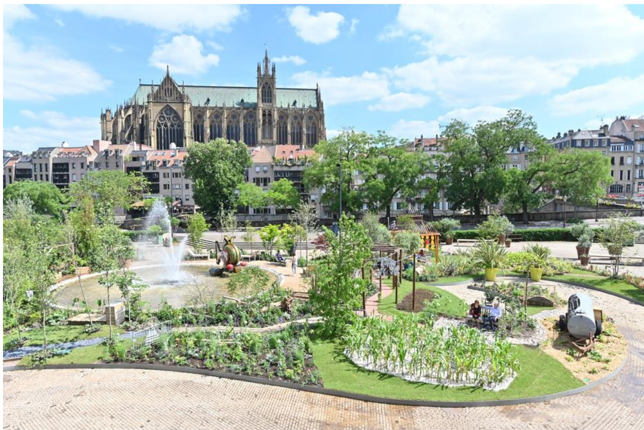
Constellations de Metz 2021, Jardin éphémère « L'eau et le feu », Place de la Comédie