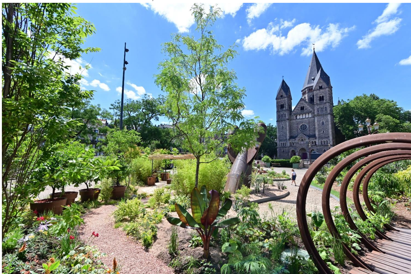
Constellations de Metz 2022, Jardin éphémère « En voir de toutes les couleurs », Place de la Comédie