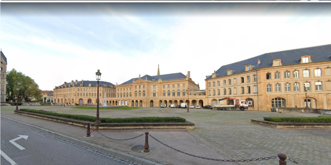
Photos de la Place de la Comédie datant d'octobre 2022