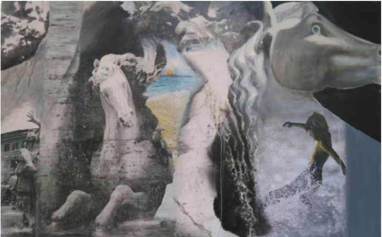
4. Nicole King, Des Glaciers aux fontaines, le cycle de l'eau », (série Fontaines inspirée de la place Navone à Rome ), 2019. Technique mixte. 73x116 cm

4. Des Glaciers aux fontaines, le cycle de l'eau » : Le cycle de l'eau est représenté dans cette toile depuis la fonte des glaciers (en haut, vus d'avion) jusqu'aux fontaines de Rome (Piazza Navona). Le cheval piaffant en pierre du Bernin et la main tendue du fleuve du Nil symbolisent les tensions autour des besoins en eau potable, non satisfaits encore pour une grande partie de l'humanité. Au centre de la toile, la fenêtre en couleur symbolise l'espoir et l'arrivée de l'eau des fleuves jusqu'à l'océan.