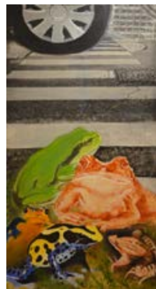
1. Nicole King, Triste passage (ou la Disparition des batraciens) , 2018. Technique mixte, report photo. 120x60 cm

1. Triste passage (ou la Disparition des batraciens) : La biodiversité disparaît rapidement : 41 % des amphibiens (2100 espèces) et un quart des mammifères sont menacés. Nicole King a choisi de peindre des grenouilles parce qu'elles appartiennent à la classe d'animaux la plus menacée : le taux naturel d'extinction devrait être d'une espèce tous les mille ans, et ce taux a été multiplié par 45 000 pendant l'Anthropocène. La propagation d'un champignon mortel due à des expériences de laboratoire non supervisées est la principale cause de cette extinction dévastatrice*. N'oublions pas que la grande majorité des organismes vivants n'a même pas encore été découverte. «The 6th Extinction», Elizabeth Kolbert, essai du prix Pulitzer 2015.