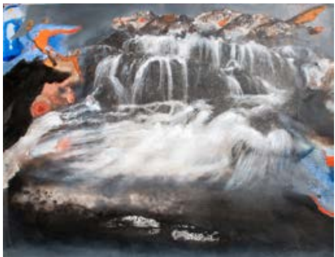
2. Nicole King, Passage au noir, (la Cascade) , 2016. Technique mixte. 50x65 cm