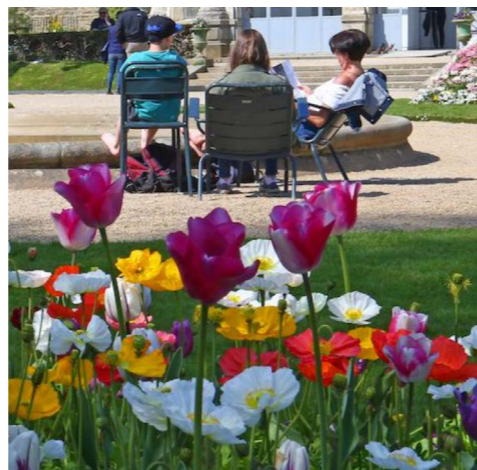
Parc du Thabor