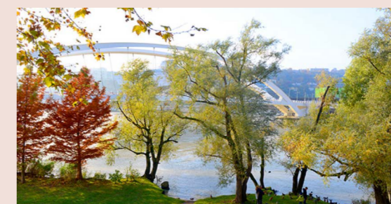
Parc de la Tête d'Or

La capitale des Gaules est en 4 e position des villes les plus vertes de France !