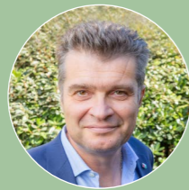
Laurent Bizot, Président de l'Unep et co-président de l'Observatoire des villes vertes