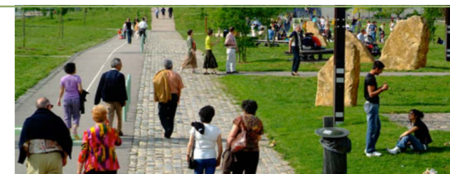
Parc de la Seille

Un plan de reconquête des interstices urbains a aussi permis la création de 195 jardins de rue en 2 ans.