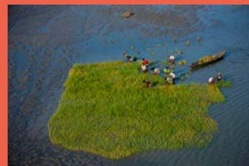
Repiquage du riz au Bangladesh.

L'eau disponible pour l'homme représente 0,5 % de l'eau douce de la planète. C'est toujours la même eau qui circule. Parce que l'eau que nous buvons aujourd'hui a été bue hier et sera bue demain, sans doute, par quelqu'un d'autre : c'est le cycle de l'eau. Comme l'or noir, l'or bleu n'est pas inépuisable. À nous donc de trouver les bonnes solutions pour empêcher l'eau de nous filer entre les doigts.