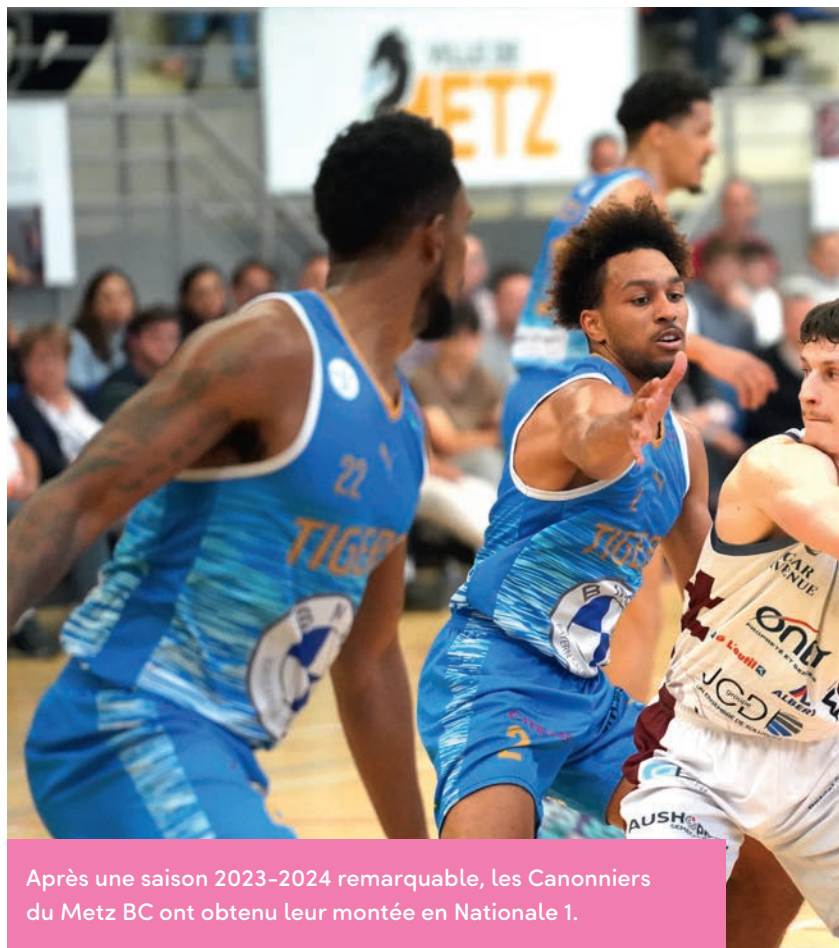
Après une saison 2023-2024 remarquable, les Canonniers du Metz BC ont obtenu leur montée en Nationale 1.

Le passage de la flamme olympique à Metz restera gravé dans les mémoires, rassemblant pas moins de 40 000 personnes sur son parcours. Le succès de l'Animation estivale, avec 2 627 enfants inscrits cet été, une centaine de plus que l'an dernier, et 96 % des séances réservées, a plus que jamais fait naître des passions, permis de s'initier et encourager à une pratique sportive (ou artistique) régulière tout au long de l'année, en donnant l'envie aux jeunes d'adhérer à un club à la rentrée. Dernièrement, la Fête du sport les 14 et 15 septembre, organisée par le Comité Départemental Olympique et Sportif de Moselle en partenariat avec la Ville de Metz, avec plus de 50 clubs sportifs réunis aux Arènes et au parc de la Seille, a elle aussi fait découvrir au public de nombreuses disciplines et motiver les inscriptions pour l'année.