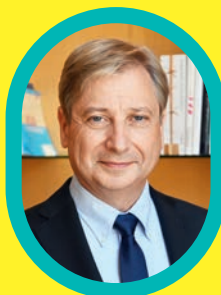
François Grosdidier Maire de Metz

Dans un souci didactique, les modifications apportées à l'environnement scolaire font l'objet d'enseignements pratiques aux élèves dès que cela est possible, en concertation avec les équipes pédagogiques, à l'image des possibilités offertes par la végétalisation des cours d'école.