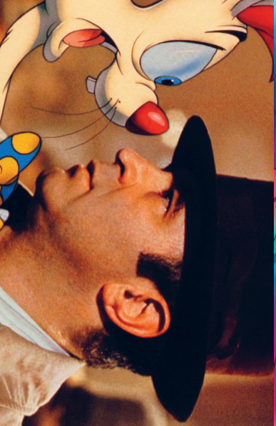
QUI VEUT LA PEAU DE ROGER RABBIT