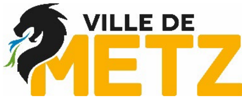
Schéma de promotion des achats socialement et écologiquement responsables