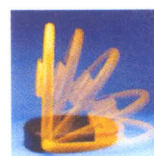
Parking boys (système à ressort)