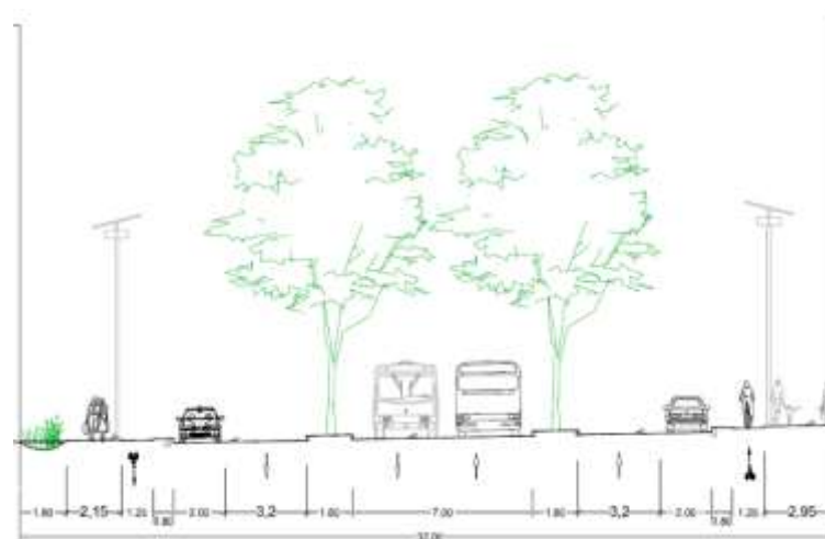
L'avenue centrale de 32 mètres.

A terme, l'avenue centrale remplacera la rue Ducrocq sur ce tronçon en supportant les flux routiers puisque cette dernière est destinée à devenir une promenade modes doux sur la Seille avec un accès automobile limité (riverains uniquement).