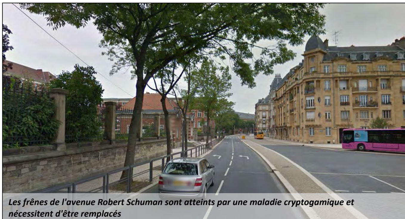
Les frênes de l'avenue Robert Schuman sont atteints par une maladie cryptogamique et nécessitent d'être remplacés