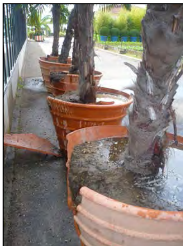
Remplacement de bacs vieillissants