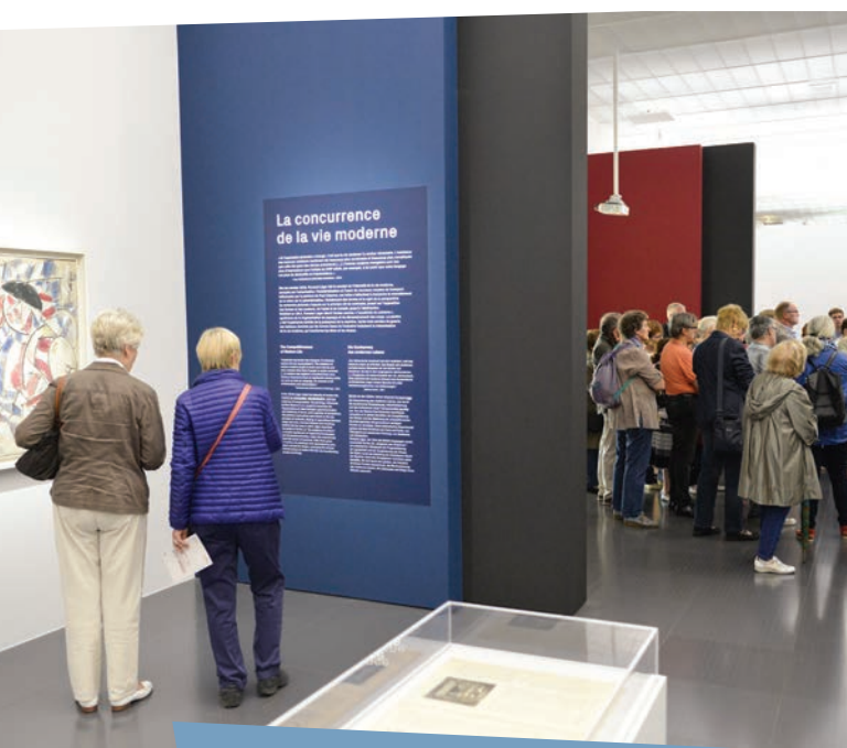
Visite de l'exposition «Fernand Léger : le beau est partout» au Centre Pompidou-Metz - le 29 juin 2017 dans le cadre de la convention avec la Ville de Metz

Les participants se disent satisfaits de l'offre d'activités culturelles et de loisirs qui existe sur le territoire et de l'implication de la ville dans l'organisation de bons nombre de ces actions. Pourtant, plusieurs d'entre eux signalent ne pas être assez ou bien informés sur les événements et les modalités de participation ou d'aide à ces manifestations.