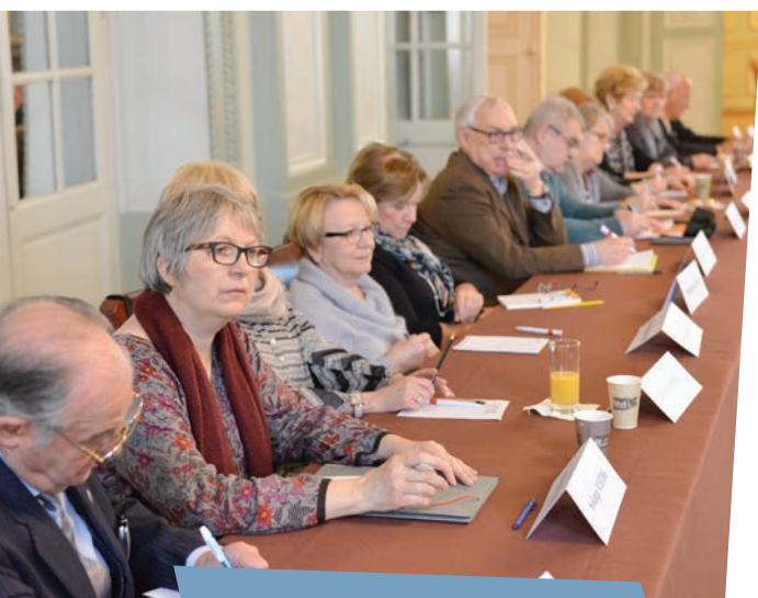
Séance plénière du Conseil des seniors.

Les participants accordent des vertus positives au bénévolat mais regrettent un manque de connaissance de l'offre dans ce domaine et un manque de reconnaissance de l'implication bénévole.