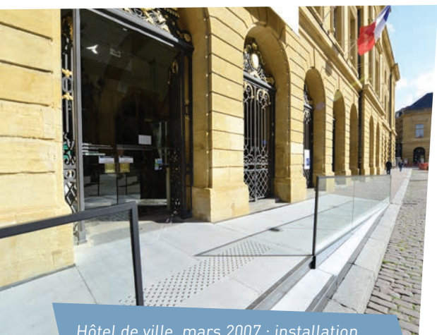
Hôtel de ville, mars 2007 : installation d'une rampe pour faciliter l'accès des personnes à mobilité réduite aux services de la ville.

L'espace urbain adapté est un facteur important de la vie sociale en particulier lorsque la mobilité diminue. Dans ce cas, il peut être facteur d'isolement.