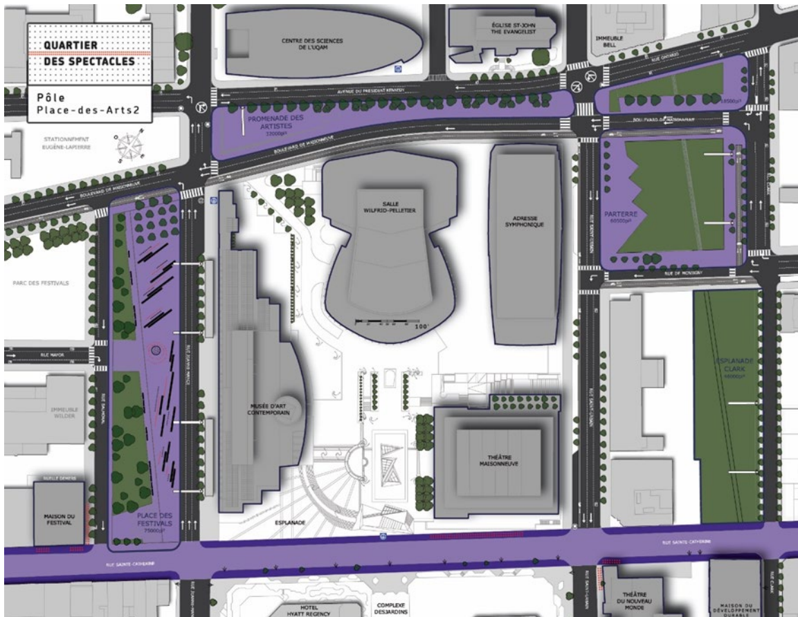
Plan du Quartier des spectacles à Montréal