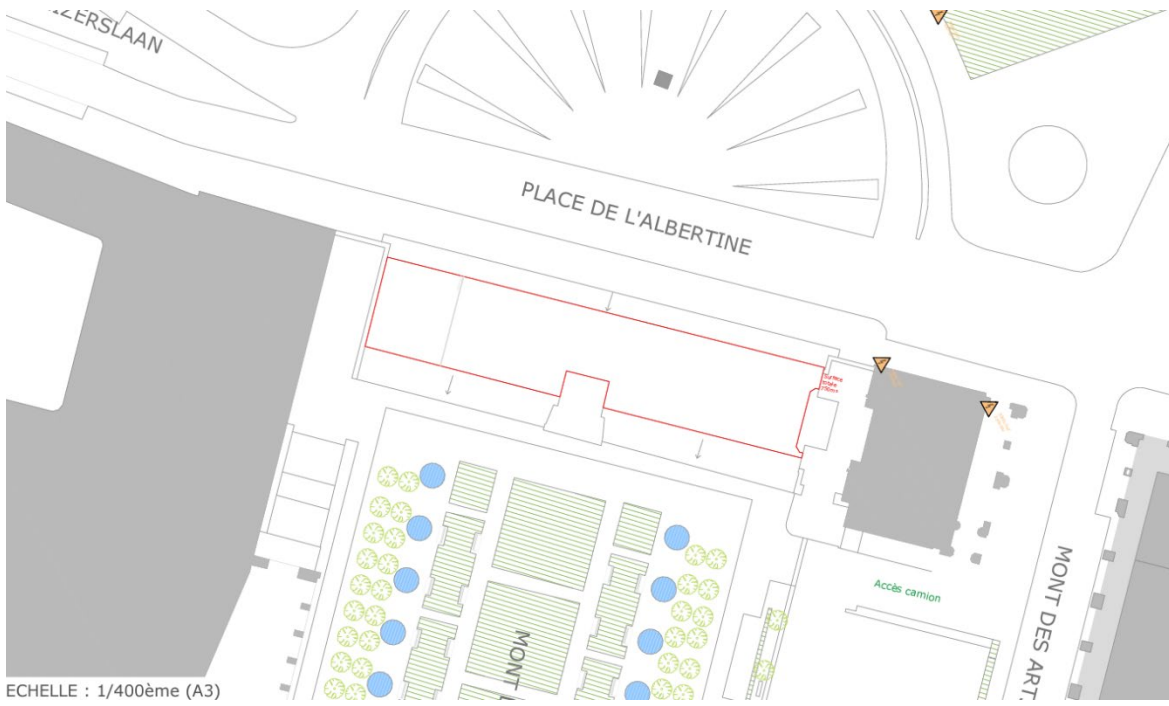
Plan du Mont des Arts à Bruxelles