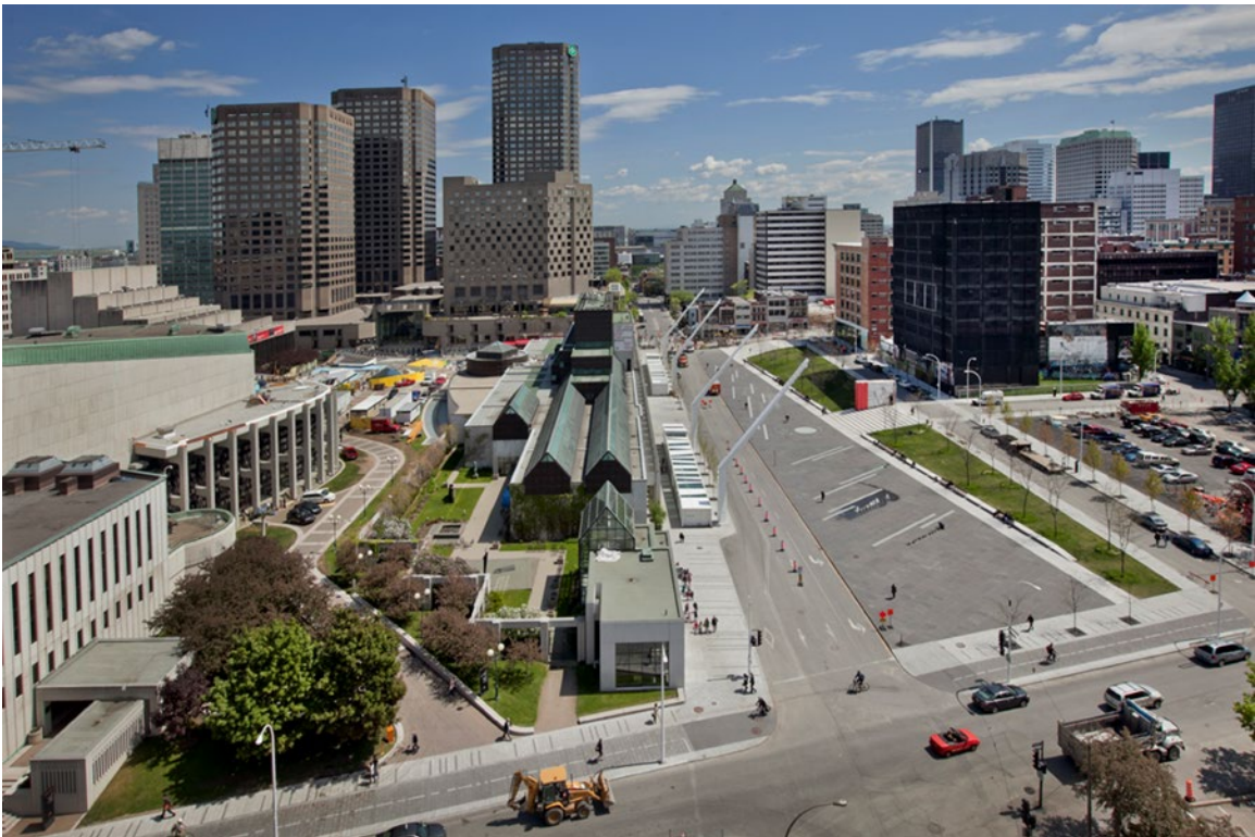
La place des Festivals dans le Quartier des spectacles à Montréal