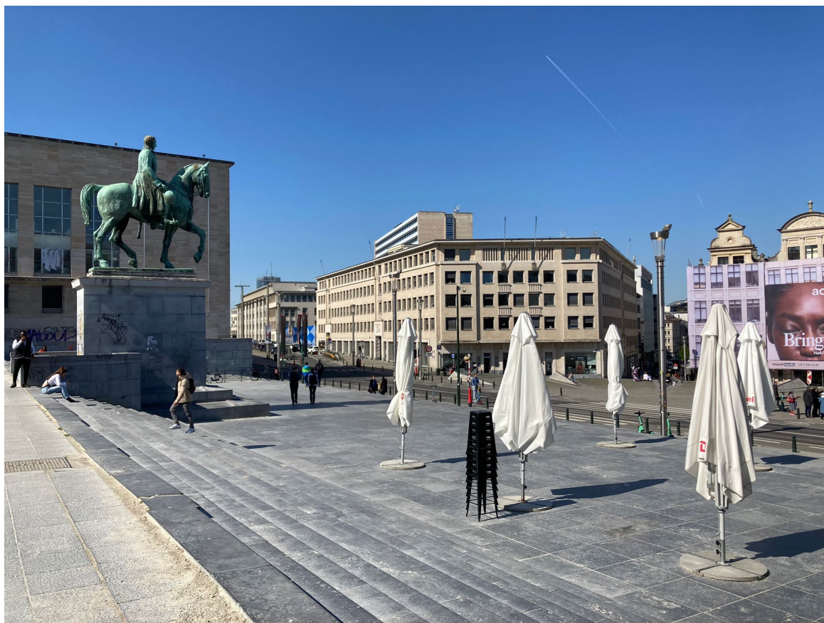
Le Mont des Arts à Bruxelles

Ci-après des photos et un plan du Mont des Arts à Bruxelles :