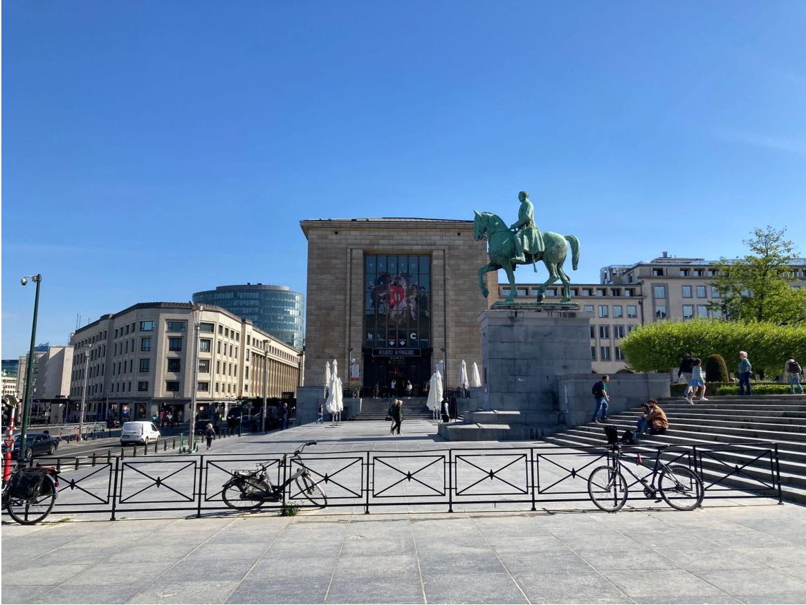
Le Mont des Arts à Bruxelles