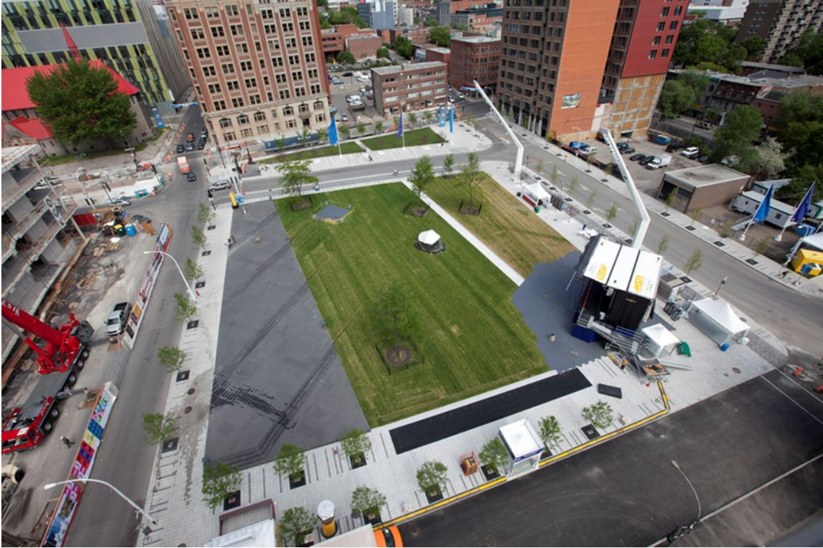
Le Parterre dans le Quartier des spectacles à Montréal