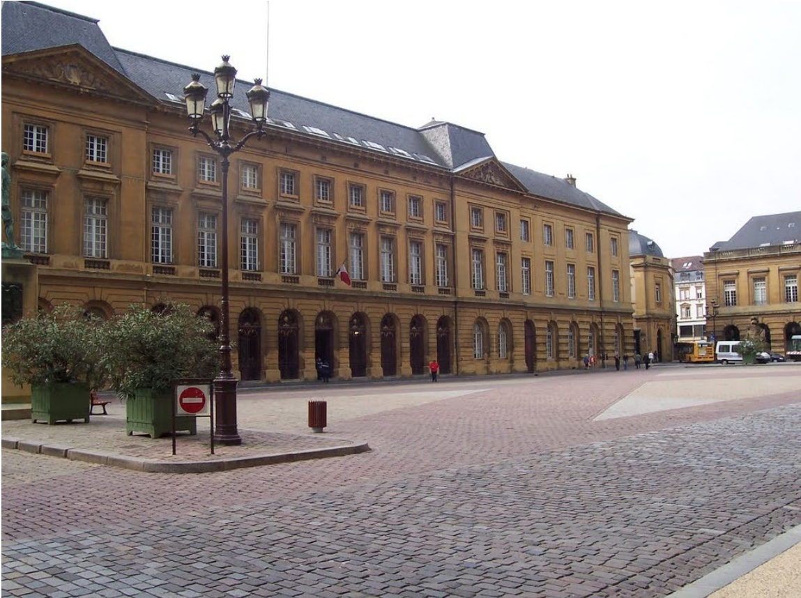
La place d'Armes à Metz

Ci-après une photo et un plan de la place d'Armes à Metz :